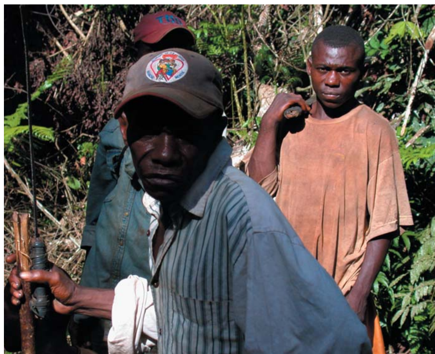
Les Pygmées, une composante importante des populations des forêts

prometteuse, mais les bilans récents de l'ensemble du processus ont été alourdis de nombreuses critiques (CUNY et al., 2004, VERMEULEN et al., 2006). Cependant, à l'instar des espaces de conservation, l'engouement pour les forêts communautaires a occulté l'autre dimension de la participation des populations, le domaine forestier permanent. Pourtant, les Unité Forestières d'Aménagement (UFA) représentent par leur étendue l'espace légal principal auquel les populations vont se trouver confrontées dans la nouvelle donne forestière (43% du territoire zoné au Cameroun). AUZEL et VERMEULEN (1999) comparent (Tableau II.) les modalités de délimitation des forêts du domaine permanent (MINEF/DF, 1997) avec les critères énoncés par le manuel des procédures des forêts communautaires (MINEF/CFU 1997). Il ressort du tableau II. que les étu-