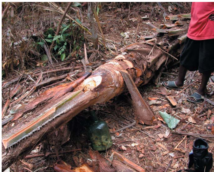
La collecte de vin de palme, une activité villageoise séculaire parfois effectuée en pleine UFA sur les sites d'anciens villages.

La création des Unités Forestières d'Aménagement est un bouleversement important en termes de perception de