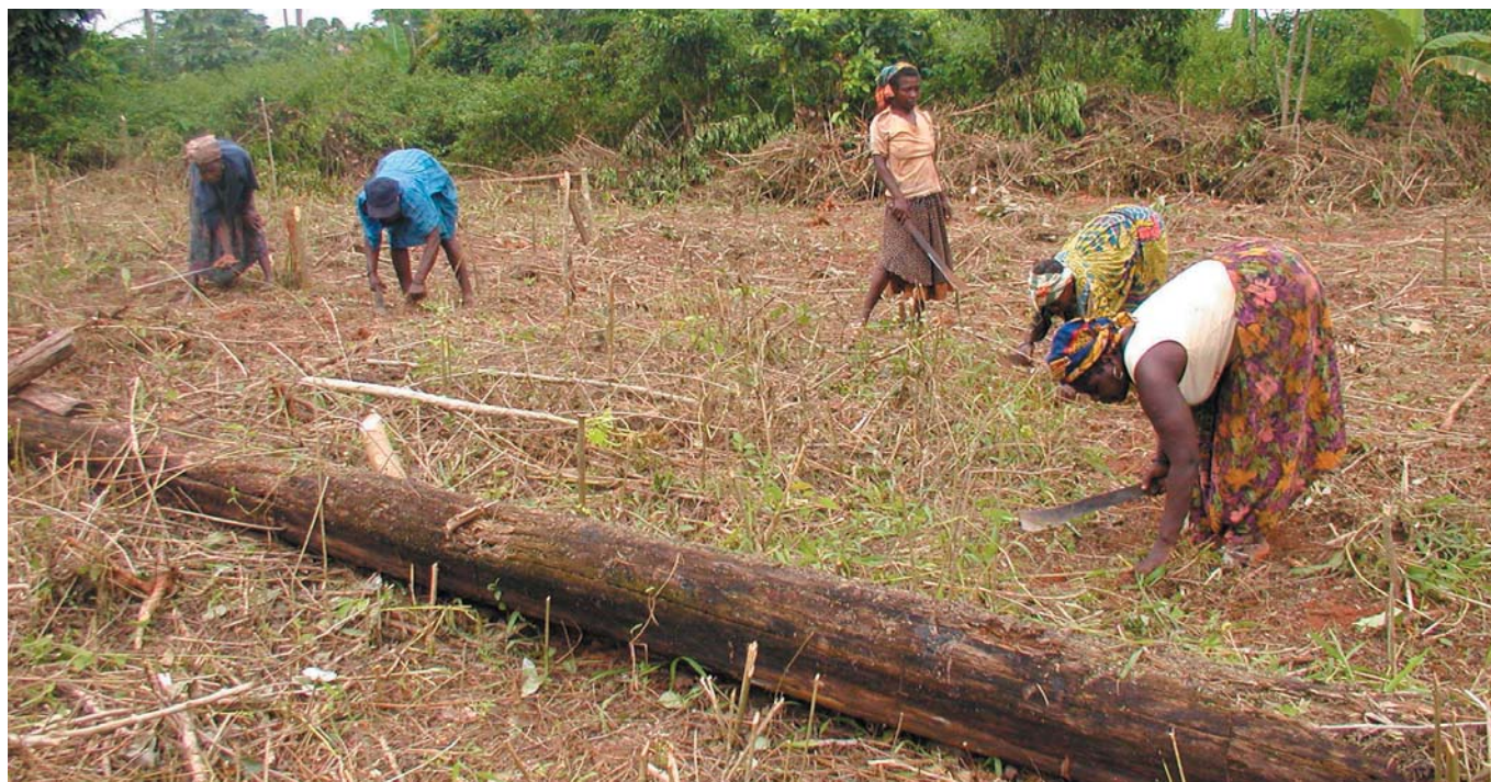
Les cultures sur brûlis