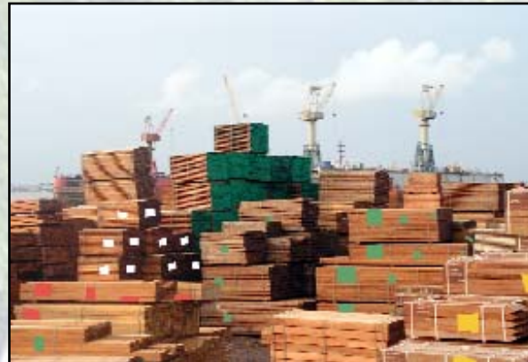
Développement de l'économie nationale