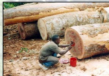
... pour la traçabilité du bois