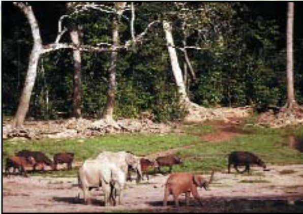
Maintien de la biodiversité