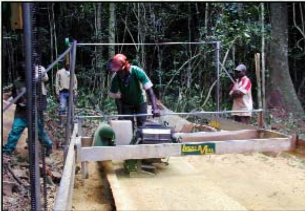
Lutte contre la pauvreté